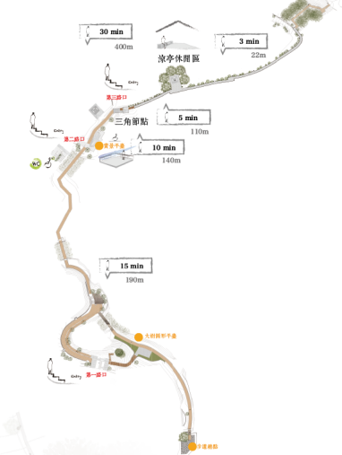
廁所 (與自然界的融合)

在人們也能在廁所是與大自然接觸。男廁的牆壁高度調整為150高，上廁所時，他們可以透過那個高度向外圍，享受著大自然。女生在洗手的時候，也能感受到周圍的大自然風光。總體來說，整間廁所都能讓人們體驗大自然風光，與大自然交流。